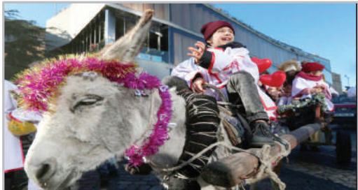
جشن کریسمس مسیحیان ارتدوکس - شهر تفلیس گرجستان