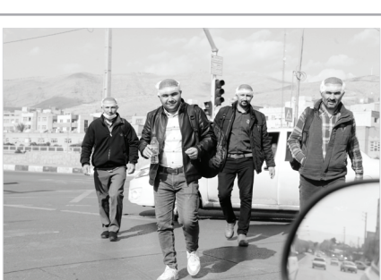
استاندار فارس در جریان بازدید از پروژه احداث خط مترو شیراز

نهادینه کند. ساخت مسکن و ایجاد شغل برای جوانان جویای کار معمولاً فاکتورهای دیگری است که می‌تواند بعد از تهسیلات در امر ازدواج اثرگذار باشد؛ چراکه جوان امروزی وقتی شغلی ندارد و از پسنس اجناساط وام ازدواجش نیز بر نمی‌آید، طبیعی‌ست که قید ازدواج را هم بزند. دولت تلاش می‌کند با افزایش این وام جوانان را به ازدواج تشویق کند؛ اما به باور بسیاری از کارشناسان این حوزه علت اصلی تأخیر قطعی ازدواج، وضعیت اقتصادی، سیاسی و فرهنگی جامعه است. شاید یکی از دلایلی که بتواند جوانان را به ازدواج ترغیب نماید این است که زندگی جوانان پیش از آنها دارای استحکام لازم باشد و از آمار طلاق کاسته شود. کاهش آمار طلاق خود می‌تواند انگیزه فرهنگی