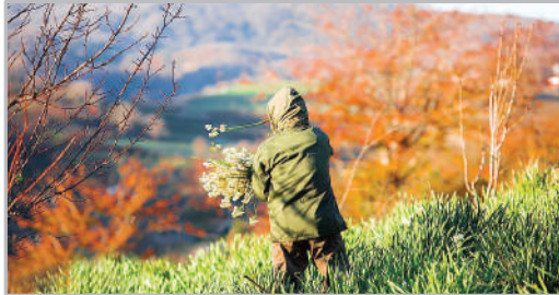
برداشت گل نرگس - مزارع مازندران