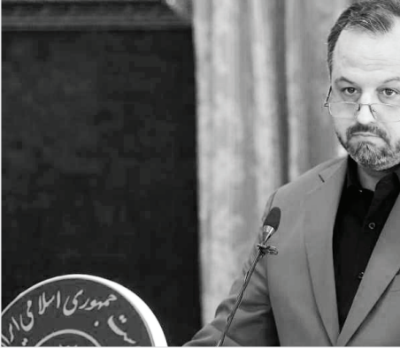
وزیر اقتصاد اعلام کرد:

موضوع تولید و رشد اقتصادی مستمرا در سال‌های اخیر ضعیف و ضعیف‌تر شده است. وی خاطرنشان کرد: بهترین شرایط قدرت درآمدی خانوارها در سال ۱۳۹۰ بوده است.