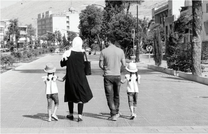
یک خانواده جوان در حال پیاده‌روی در پارک

مشکلی نداشته‌اند. شاید حتی آن‌ها برای تشکیل زندگی خود به وام ازدواج نیازی هم نداشته باشند؛ بنابراین درمی‌یابیم که مشکل بسیاری از زندگی مردم نبود آگاهی و ندیدن آموزش صحیح مهارت‌های زندگی‌ست که منجر به جدایی زوج‌ها می‌شود. به نظر می‌رسد بهتر