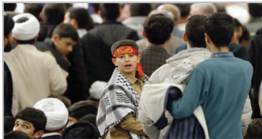
در حاشیه دیدار مردم قم با رهبر انقلاب