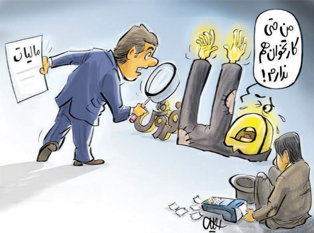
شغل طلایی با اجرت و سود حداکثری و مالیات حداقل!