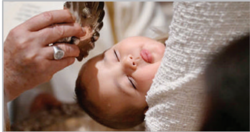
غسل تعمید یک نوزاد از سوی پاپ فرانسیس - کلیسای ایتیکان